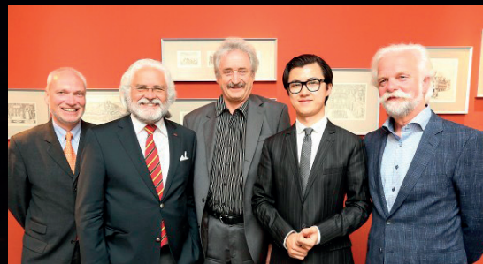
konzerte, ein Werkstattgespräch, eine öf-