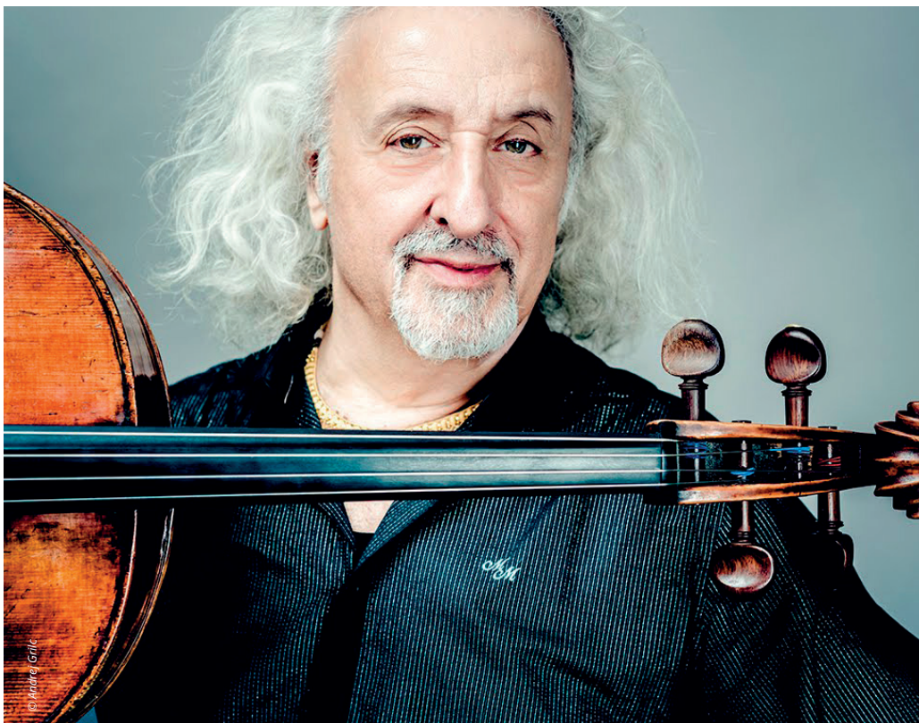
MISCHA MAISKY (Violoncello)

ist der einzige Cellist weltweit, der sowohl bei Mstislav Rostropovich als auch bei Gregor Piatigorsky studiert hat.